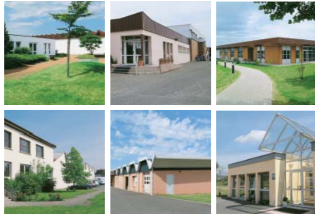
Les ateliers à Duttlenheim, Haguenau, Benfeld, Sélestat, Rothau et Wissembourg.